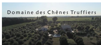
Domaine des Chênes Truffiers

Bienvenue au Domaine des Chênes Truffiers, un havre de paix de 7.5 hectares, entourée de vignes et d'arbres fruitiers, au calme et en pleine nature. Situé entre les villes Arles, Avignon et Nîmes, vous pouvez (re)découvrir de nombreux sites à petites distances comme le Pont du Gard, les Baux de Provence, la Camargue, Saint Rémy de